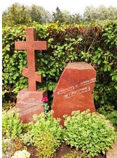
Могила Агнии Кузнецовой и Георгия Маркова на Троекуровском кладбище.

Скончалась 12 ноября 1996 года. Похоронена в Москве на Троекуровском кладбище; рядом покоится её муж, писатель Георгий Марков.